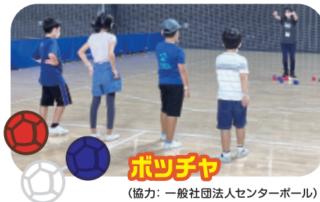
ボッチャ (協力:一般社団法人センターボール)