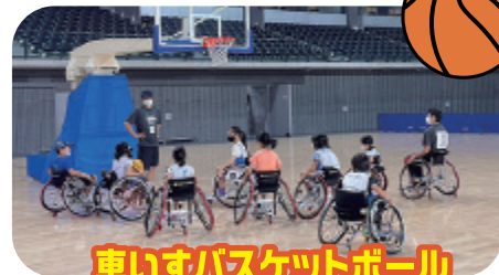
車いすバスケットボール (協力:一般社団法人センターボール)

東京ヴェルディ PRESENTS TOKYO VERDY 3x3バスケット ボール体験